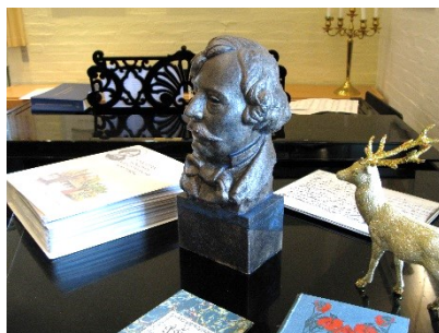
Christian Winters buste