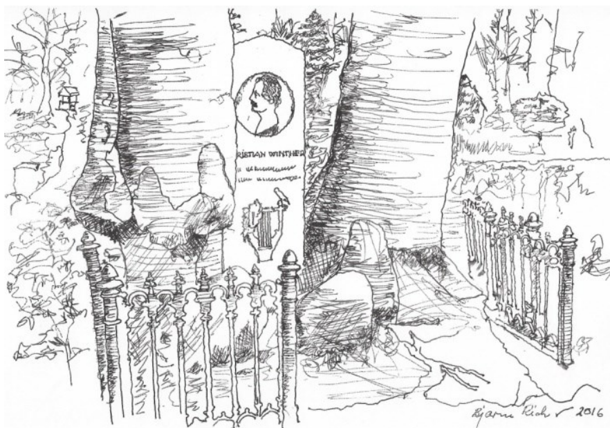
Christian Winters gravsted, Holmens Kirkegård

Christian Winters liv og levned fortæller om en stor poet med menneskelige fortrin og fejl – det sidste ligesom hos os andre.